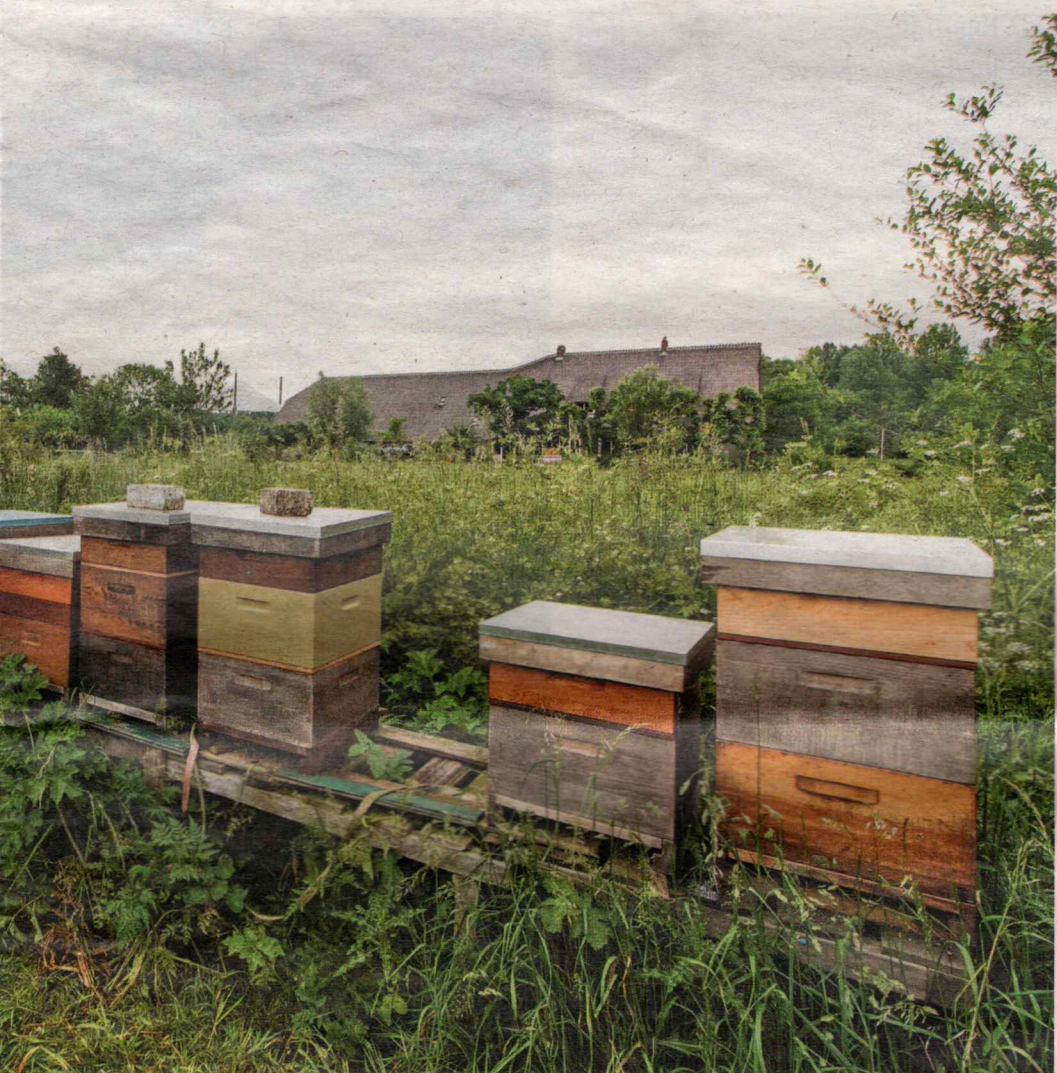
In voedselbos Oostwaard staan ook bijenkasten. Met zo veel vruchtbomen en -struiken zijn er natuurlijk bestuivers nodig.

De honingbessen zijn de eerste vruchten in het voedselbos op landgoed Oostwaard die al rijp zijn. In het vroege voorjaar kun je ook jong blad oogsten van bomen, zoals van de Franse uiensoepboom (drie keer raden waar de bladeren naar smaken) en van de linde.