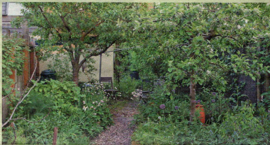
De achtertuin van Vera Greutink.

► Vera Greutink heeft een boek geschreven over het ontwerpen van een eetbare bostuin of voedselbos: Tuin smakelijk . Meer over haar voedselbossen lees je ook op de site tuinsmakelijk.nl .